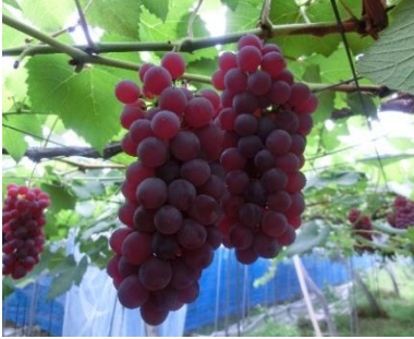
「山形産デラウェア」

糖度が高く酸味とのバランスが程よい爽やかな味覚が特徴です。種がなく、冷やして食べるとより一層美味しさを感じることができます。