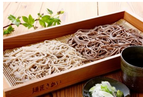
「朝打ちの生そば」イメージ