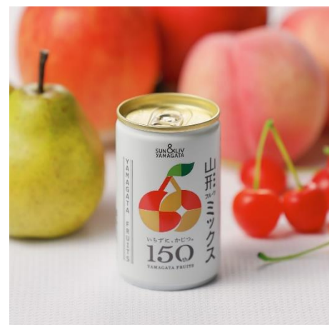
「山形フルーツミックス」

やまがたフルーツ150周年「いちず、かじつ。」 とサン&リブとのタイアップ企画商品。 4種類の果物のおいしさが、仲良く手をつなぐ 果汁100%ミックスジュース。