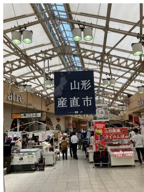
「山形産直市」イメージ