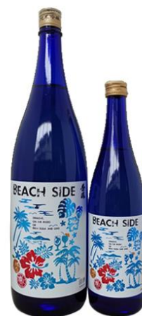
「秀鳳 純米吟醸 BEACH SIDE」 結城酒店(南陽市)イチオシの暑い夏に ぴったりの夏酒です。

※産直市の商品は収穫状況や天候の影響により入荷がない場合がございます、あらかじめご了承ください