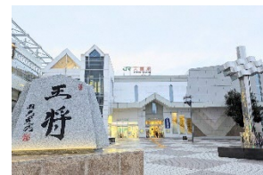
天童駅コース(イメージ)

※「駅からハイキングアプリ」では、ほかにも山形県で開催予定のコースをご覧ください。