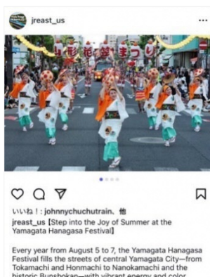
Instagram(英語)での山形花笠まつりの情報発信