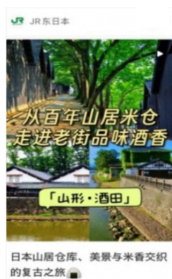
REDBOOK(中国 SNS)での酒田エリアの紹介