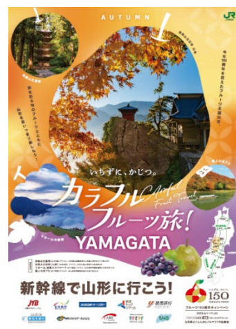
ポスター(イメージ)

旅行会社の店舗等に山形県送客ポスターを掲出することで山形県への旅行機運の醸成を目指します。