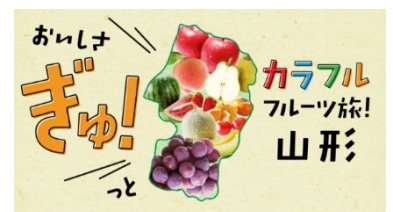
プロモーション動画(イメージ)