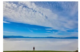
十分一山の雲海(イメージ)