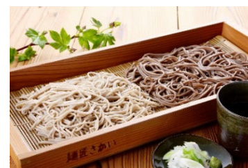
名産品そば(イメージ)