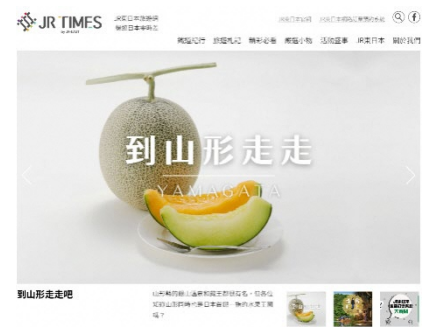
山形県産フルーツフェア JR TIMES での PR(イメージ)