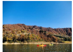
白川湖カヌーツアー(イメージ)

雄大な自然に囲まれた白川湖をカヌーでめぐり、2 時間の体験アクティビティ。春には水没林の景色が幻想的な白川湖で、季節の変化とともに変わりゆく美しい山形の景色を湖上からガイドと一緒に楽しみいただけます。ガイドツアーで漕ぎ方からレクチャーしますので、全く経験のない初心者の方、ご家族連れでも安全に楽しく体験することができます。