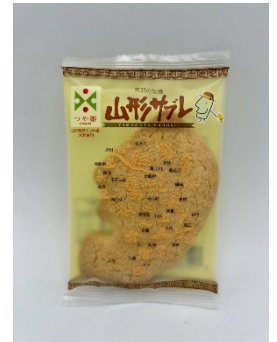
山形サブレ(イメージ)