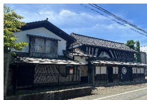
長井駅コース(イメージ)