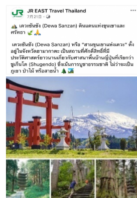
Facebook(タイ語)での鶴岡エリアの紹介