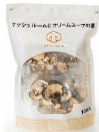
マッシュルームと クリームスープの素