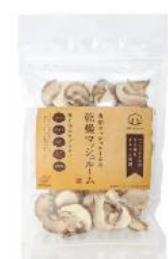
乾燥マッシュルーム

マッシュルームの特徴である旨味をギュッと閉じ込めたスープの素など、「舟形マッシュルーム」の代表的な加工品です。