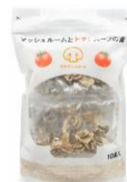
マッシュルームと トマトスープの素